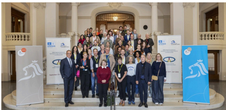
Rencontre régionale, Luxembourg