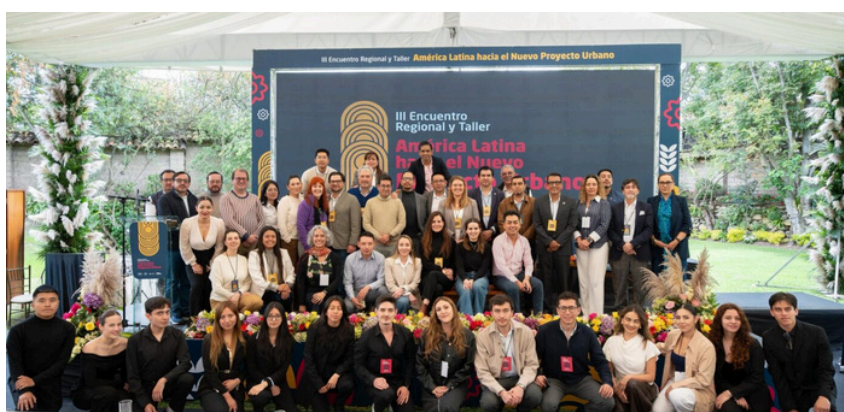
Rencontre régionale, Cuenca