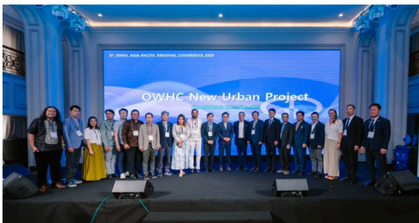
5 e Rencontre régionale, Hué