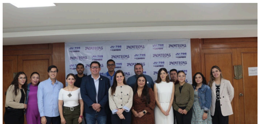
NPU Flash à Zacatecas