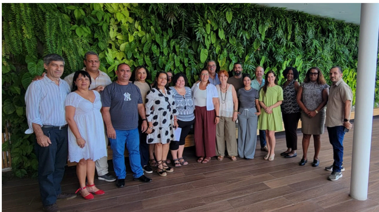
CityLab à La Havane

7 CityLabs, ont permis à une centaine de représentants de plus de 60 villes de travailler des thématiques additionnelles et de collecter des contributions à la définition de l'habitabilité de toutes les régions du monde. Pour 3 de ces CityLabs (dans les Caraïbes, en Afrique et en Asie), l'OVPM a pu se rapprocher de villes membres jusque-là peu impliquées dans la démarche du NPU. Trois CityLabs ont été possibles grâce à la collaboration des Secrétariats régionaux d'Europe du Nord-Ouest et l'Amérique du Nord, d'Asie-Pacifique et de l'Amérique latine. Le CityLab d'Amsterdam a été coorganisé avec « l'Alliance européenne pour un tourisme urbain équilibré »: