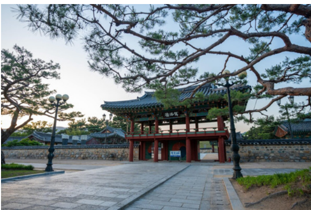
Gimhae (République de Corée)

Villes impliquées dans les activités du Nouveau Projet Urbain