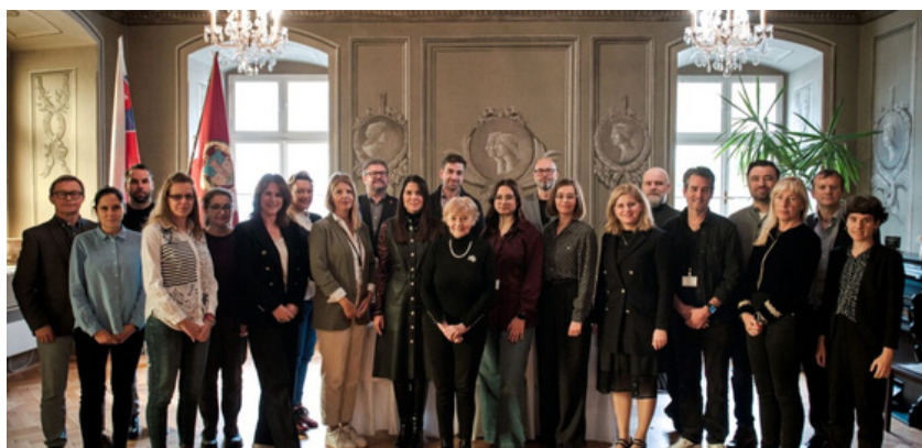
15.º Encuentro regional, Cracovia