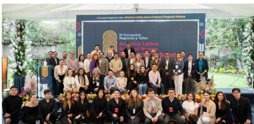
Encuentro regional, Cuenca