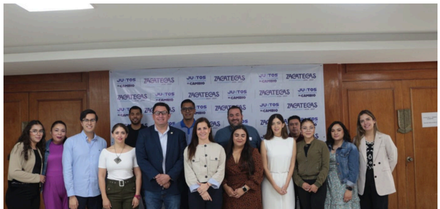
NPU Flash en Zacatecas