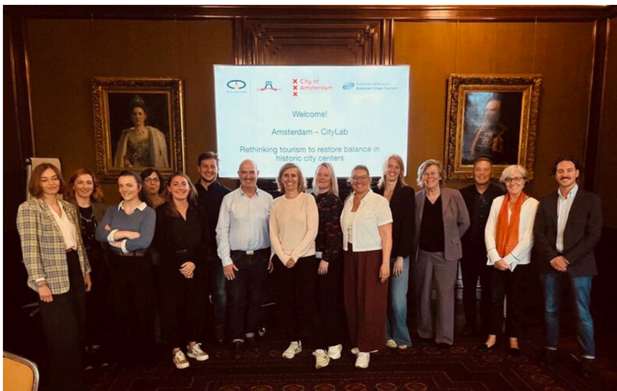
CityLab en Ámsterdam

Todos los informes de estas reuniones se encuentran en el sitio web de la OCPM: https://www.ovpm.org/es/programa/recursos/