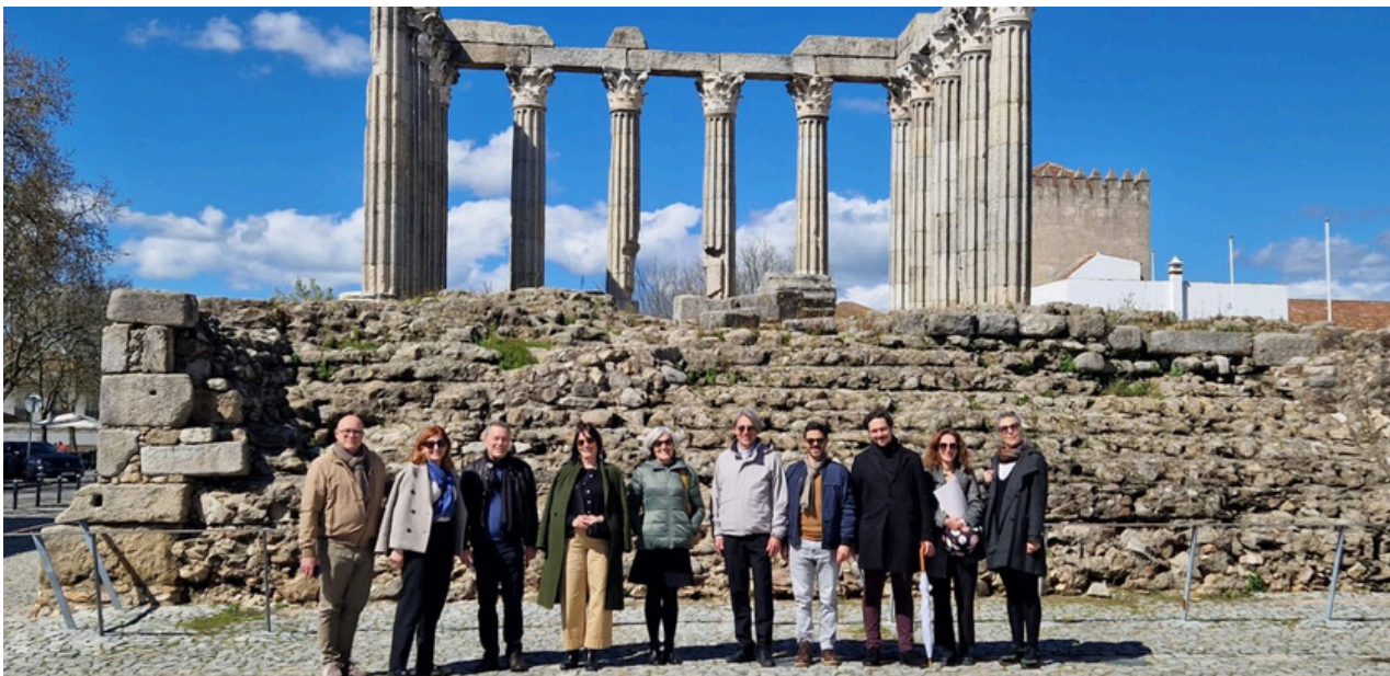
Comunidad de práctica en Évora