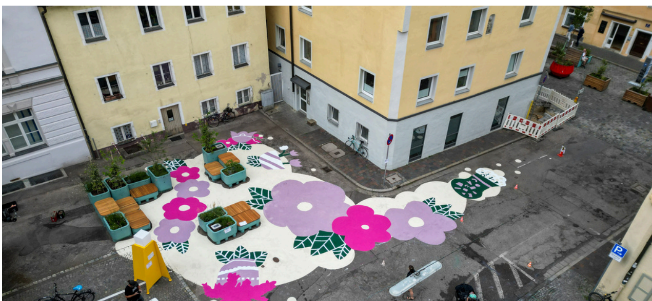
Peatonalización del casco antiguo.

La iniciativa lanzada el 4 de junio de 2025, inspirada en las Redes Colaborativas y la Comunidad de Práctica, ha tenido como objetivo construir una base de datos estructurada a partir de las experiencias replicables de las ciudades miembro y de sus logros locales, con el fin de impulsar la regeneración de la habitabilidad en los centros históricos. Inicialmente alineada con los objetivos identificados en el Informe de Évora, la recopilación de Buenas Prácticas evolucionó hasta convertirse en una actividad independiente que continúa desarrollándose en la actualidad.