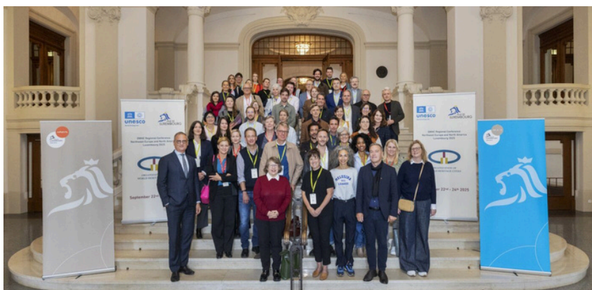
Encuentro regional, Luxemburgo