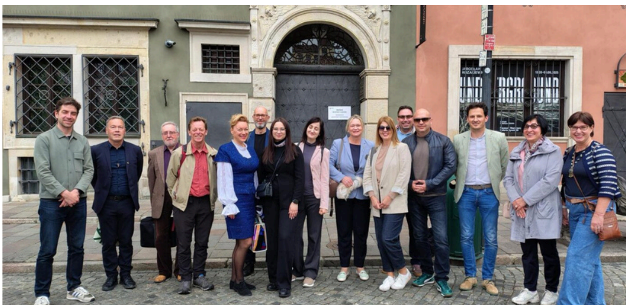
Programa de Asistencia en casos de Emergencia: taller en Varsovia