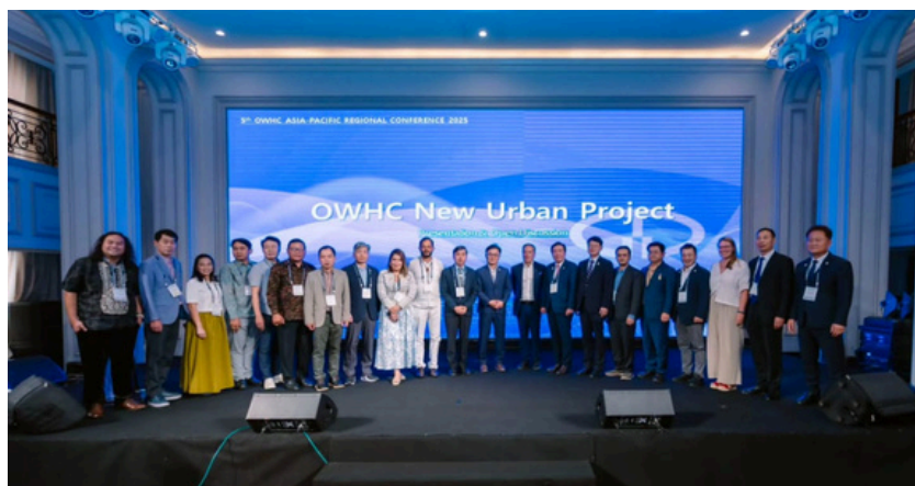
5.º Encuentro regional, Hué