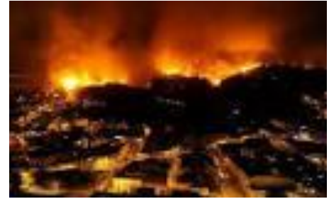
Incendio de Valparaíso

TIPOLOGÍA DE LA CIUDAD: Aglomeración de influencia regional