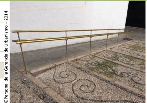
Crecer ante la adversidad