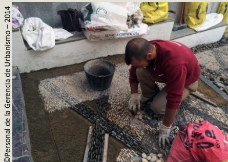
Crecer ante la adversidad