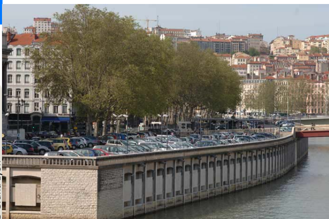
Un parc de stationnement à démolir dans le centre historique de Lyon