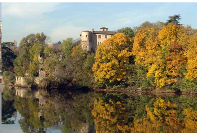
Le visage bucolique de la Saône